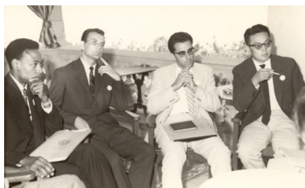
Orthodoxe afgevaardigden uit Afrika, Amerika, het Midden-Oosten en Azië

Het missiewerk bracht vader Anastasios vanaf de jaren 60 meerdere malen voor lange tijd naar Afrika. Ooit beschreef hij hoe hij in die tijd worstelde met de vraag, of hij alles wat hem dierbaar was achter wilde laten om naar Afrika te gaan. Toen welde een gedachte op uit zijn