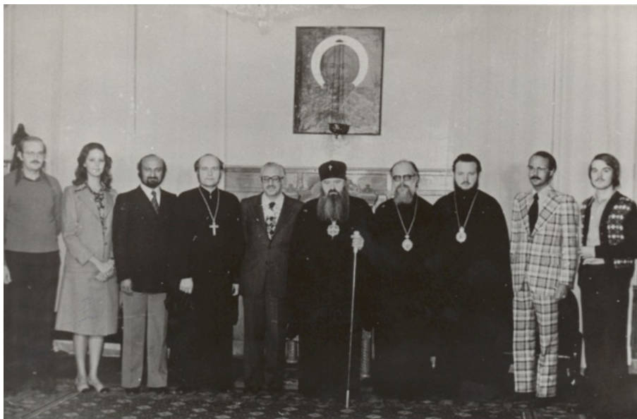
Het Syndesmos-bestuur te gast bij metr. Nikodim, 1977. Derde van rechts: bisschop (nu patriarch) Kirill. Vierde: bisschop Anastasios.

It is unthinkable that the Divine Eucharist, the mystery par excellence of the infinite love and the utter humiliation of Christ, could be used as a weapon against another Church. Is it possible that the decision and order of the Hierarchy of the Church of Russia may cancel the energy of the Holy Spirit in the holy Orthodox churches that operate under the jurisdiction of the Ecumenical Patriarchate? Is it possible that the Divine Eucharist performed in the Churches of Asia Minor, Crete, the Holy Mountain, and elsewhere on earth, may now become unsubstantiated for the faithful Russian Orthodox? And if they come forth "with the fear of God, faith, and love" to partake of the Sacred Gifts (in these churches), is it possible that they commit "a sin", which they should confess? We proclaim that it is impossible for us to agree to such decisions. It is imperative that the Holy Eucharist, this mystery of unfathomable sacredness and unique importance, remains far removed from all ecclesiastical disagreements.