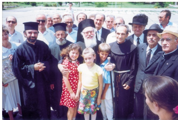
Aankomst in Albanië, 1991. Het ontvangstcomité bestaat deels uit geestelijken van verschillende religies die de vervolging hebben overleefd.

In 1991 kwam een nieuwe uitdaging. Hij was bisschop voor Kenia, Tanzania en Oeganda toen hij werd uitgenodigd om de leiding van de Orthodoxe Kerk van Albanië op zich te nemen. Een zware taak, want van deze kerk was maar weinig overgebleven. Het communistische Albanië was een van de meest strenge communistische régimes. Alle godshuizen van alle religies waren gesloten en alle geestelijken zaten in gevangenkampen. In 1991 waren nog maar zeven Orthodoxe priesters en diakens in leven. Van de ca. 20% Orthodoxen van de bevolking was het merendeel niet gedoopt. Kerken lagen in puin. Het land beleefde een grote economische crisis nadat piramideschema's vrijwel iedereen straatarm hadden gemaakt. Gewapende bendes hadden vrij spel.