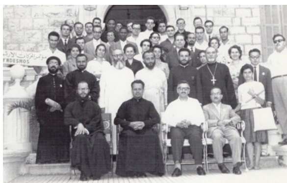
1 e rij: Aartsbisschop Anastasios en vader John Meyendorff tijdens de assemblee waar besloten werd om "Porevthendes" op te richten, 1958

Anastasios koos al jong voor een leven in dienst van de Kerk. Hij was actief in jeugdgroepen en zomerkampen. Hij studeerde theologie in Athene en Duitsland. Een van de onderwerpen die hem bezighielden was missie: waarom doen katholieken en protestanten actief aan missie, en de Orthodoxe Kerk niet? Past missie niet bij de Orthodoxie? Maar waarom zond Jezus de apostelen er dan op uit om het Evangelie te verkondigen? Waarom zijn er dan zulke grote missionarissen als Nino van Georgië, Cyrillus en Methodius, Nikolaas van Japan en vele anderen? Via zijn jeugdorganisaties kwam Anastasios in contact met een wereldwijd netwerk van Orthodoxe jeugdverenigingen, "Syndesmos". Hij ontdekte dat meer mensen zich deze vraag stelden – en ook dat er in Afrika mensen waren die zich aangetrokken voelden tot de Orthodoxie. In 1959 richtte hij samen met vader John Meyendorff een Orthodoxe missie-organisatie op onder de vlag van Syndesmos: "Porevthendes" ("Gaat heen", zie Mt. 28:19). In 1960 werd hij diaken, in 1964 als priester. In 1972 werd hij bisschop en tegelijkertijd hoofd van Apostoliki Diakonia , het diaconale en missionaire werk van de Orthodoxe Kerk in Griekenland.