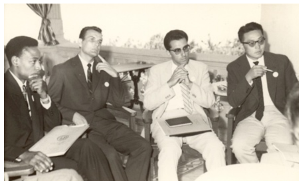
Православные делегаты из Африки, Америки, Ближнего востока, Азии.