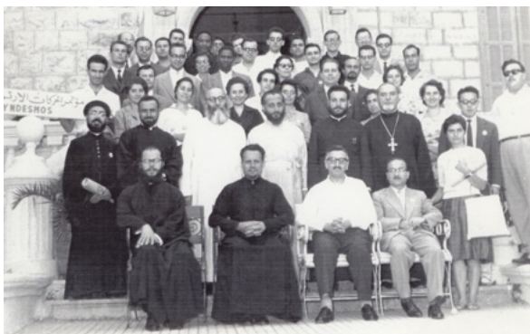
Архиеп. Анастасий и о. Иоанн Мейендорф на Ассамблее, где было принято решение о создании миссионерского центра, 1958 год.

Через свои молодежные группы будущий архиепископ Анастасий вступил в контакт с «Синдесмосом», всемирной федерацией православных молодежных движений. Он обнаружил, что в мире есть другие люди, которые задают себе этот же вопрос, а также что в Африке есть люди, которые интересуются Православием. В 1959 году он вместе с отцом Иоанном Мейендорфом под эгидой «Синдесмоса» основал православную миссионерскую организацию «Поревтендес» («Идите» [научите все народы], см. Мф. 28:19).