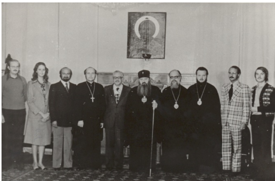
Правление «Синдесмос» встречается с митр. Никодимом, 1977 год. Третий справа – еп. Кирилл (нынешний патриарх), четвертый – еп. Анастасий.

Несколько членов нашего прихода хорошо знали архиепископа Анастасия: